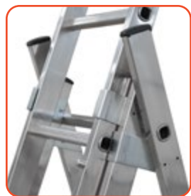
Articolazione in acciaio Steel hinge