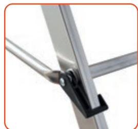
Tirante di sicurezza Security rod