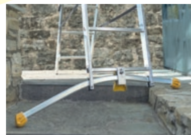
DISLIVELLO/ DIFFERENCE IN LEVEL MAX 15 CM