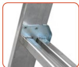
Gancio in alluminio, completo di dispositivo antiscivolo Aluminium hook as non-slipping device